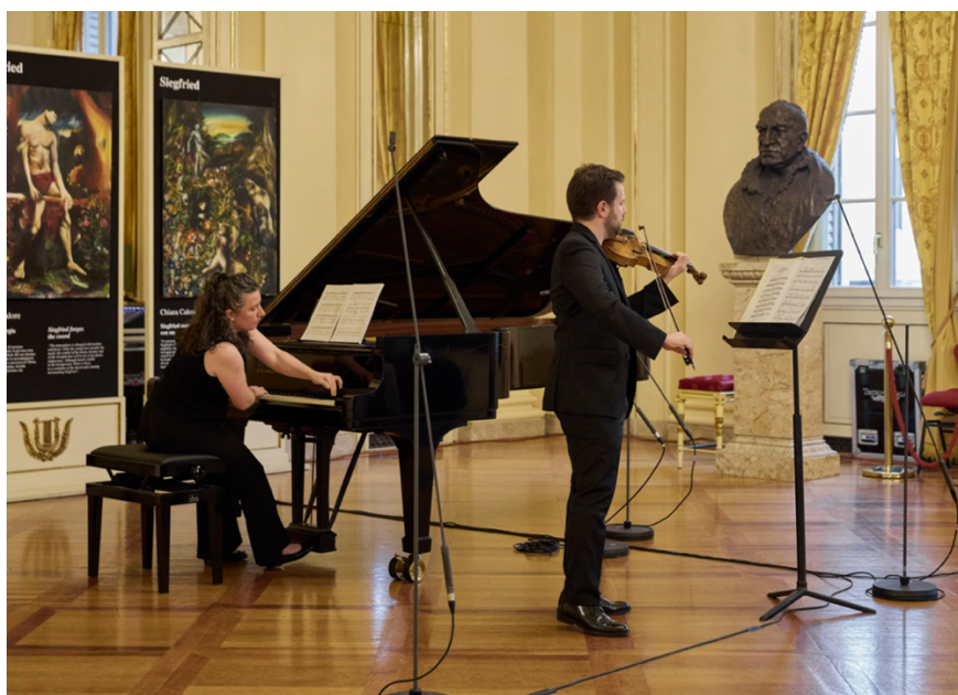
Ridotto dei Palchi del Teatro alla Scala, Festival Milano Musica 2026